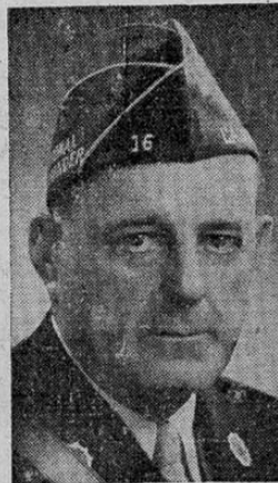
Warren H. Atherton

SAN FRANCISCO. — Warren H. Atherton, Comandante de la Legión de Veteranos de los Estados Unidos, a su regreso de un viaje de 23.000 kilómetros por la América central y del sur, ha elogiado altamente a las repúblicas americanas por su colaboración en el esfuerzo de guerra de las Naciones Unidas.