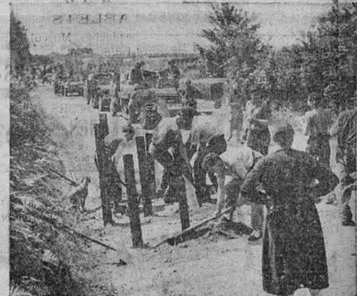
En el norte de Francia la población civil ayuda a destruir los obstáculos de rieles colocados por los nazis en retirada con la idea de retardar el avance de las fuerzas de los Estados Unidos que, cuando llegaron a la región, hallaron la labor casi terminada.